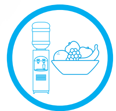
WASSERSPENDER & OBSTKORB

Du fühlst dich angesprochen? Dann bist du bei uns genau richtig!